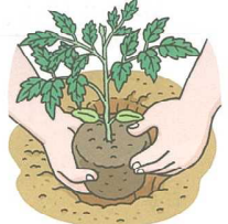
ねをきずつけないようにそっとうえる。