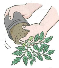
なえをそっととり出す。