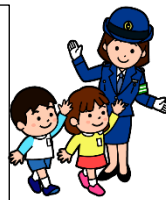
【1年交通安全教室の様子】

特に自転車は、バイクや自動車と同じように軽車両で、被害者になるだけでなく、加害者にもなってしまう可能性もあります。ヘルメットをかぶって、交通ルールをしっかりと守って乗りましょう。