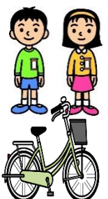
【4年交通安全教室の様子】